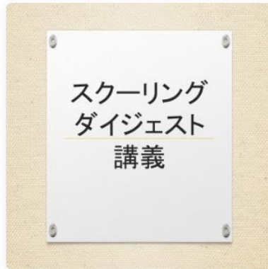
介護過程Ⅲスクーリング ダ...

① HAPPY&SMILE COLLEGE ထိပ်တန်း- ထိပ်မျက်နှာပြင်သို့ ပြန်သွားပါ။